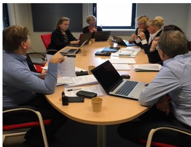
Coachoverleg Ad Service, Welzijn & Zorg

Belangstellenden zijn van harte welkom tijdens de informatieavond op 27 maart, op NHL Stenden Hogeschool in Leeuwarden.