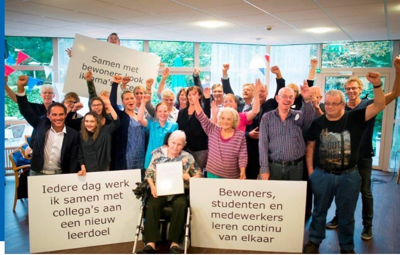
Meriant leerbedrijf van Friesland 2017

Er is daardoor gesproken over hoe de werkende lerenden (wat jullie zijn, anders dan sec student) informatie hebben weten te verzamelen voorafgaand aan de start van de opleiding en de inschrijving, waaronder de voorlichtingsbijeenkomsten. Over of er wel of geen intakegesprek is geweest, hoe leeruitkomsten kunnen worden bereikt, het hoe en wat t.a.v. de onderwijsovereenkomst, of er wel of geen rooster is, welk onderwijsmateriaal wordt gebruikt,